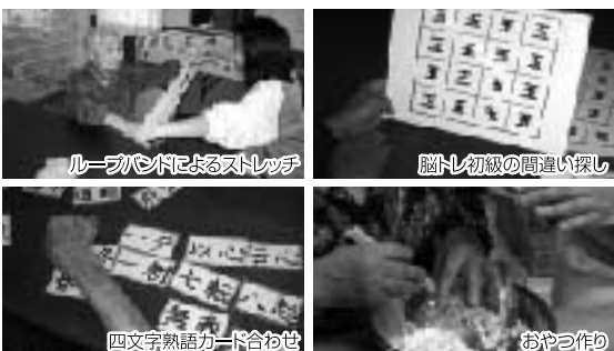
ルーブリッドによるストレッチ