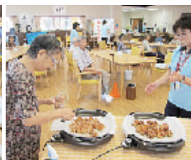
▲レクリエーション(たこ焼き作り)