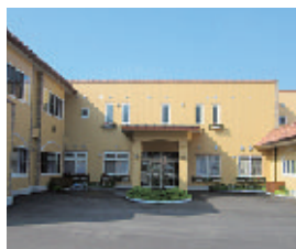
▲プロバンス地方をイメージした外観