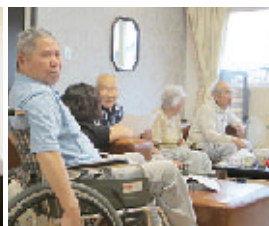
▲共有スペースでの楽しい会話