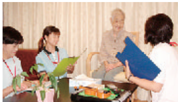
▲皆様に寄り添った支援を提供させていただきます。