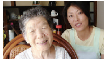
▲「いつも笑顔で」をモットーに、日々奮闘致しております。