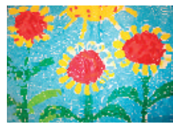
▲8月。貼り絵作成。来客者や職員・利用者様が拝見できるよう廊下に展示しております。