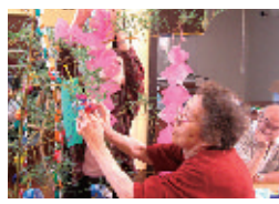
▲七夕。飾り付けなど、利用者様も積極的に参加して頂きました。